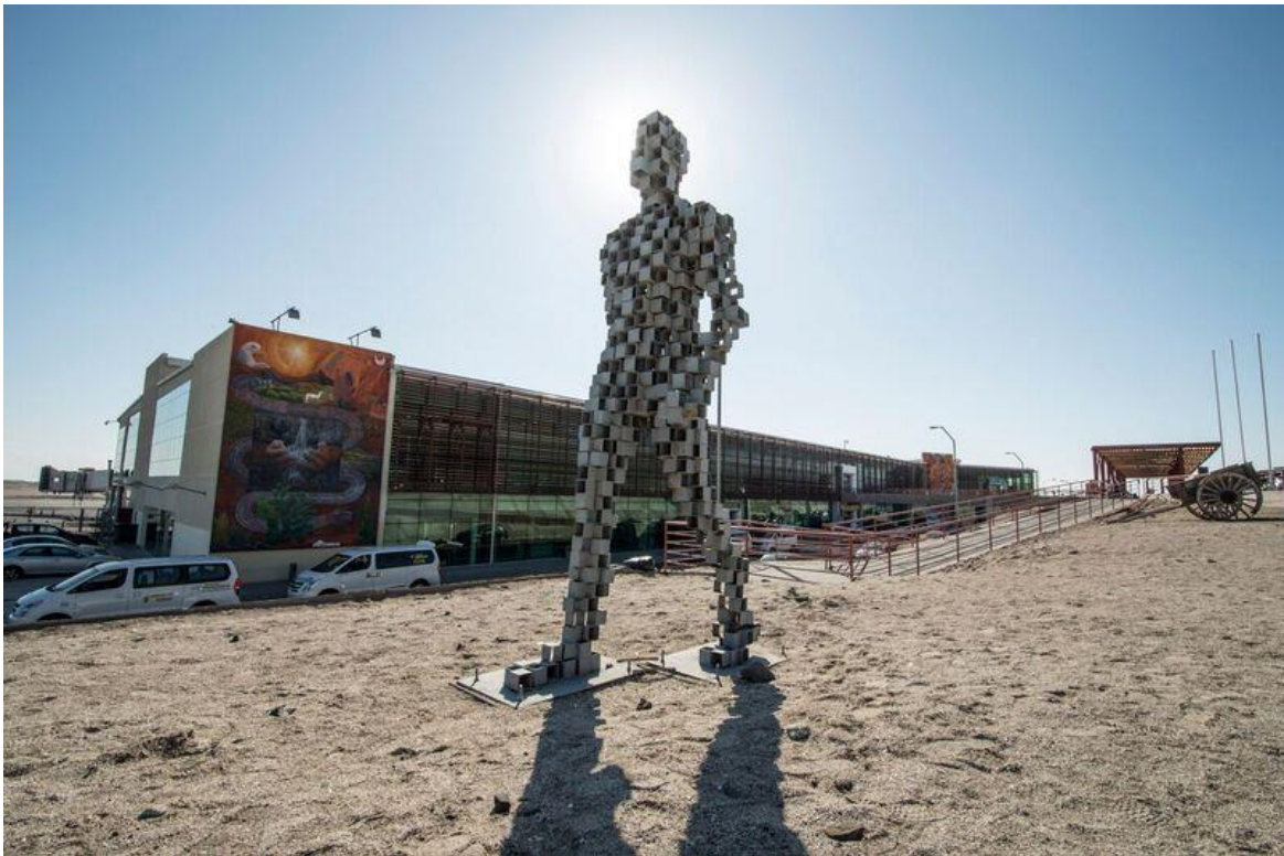
Aeropuerto Diego Aracena de Iquique // I Región de Tarapacá // Chile